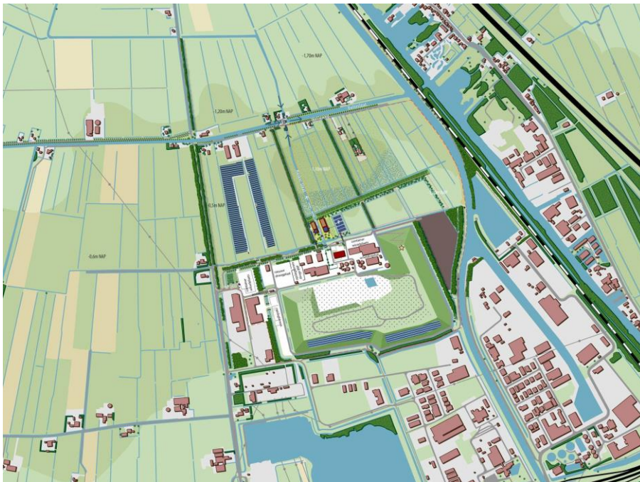
fase 1 ontwikkeling Ecopark De Wierde

Belangrijk onderdeel van het project is de uitbreiding van Ecopark De Wierde aan de noordzijde. Een gedeelte daarvan is in fase 1 bestemd voor het nieuwe kantoorgebouw en een representatieve ruimte voor het ontvangen van groepen. De vrijkomende ruimte op het huidige terrein zal vervolgens worden gebruikt voor bedrijfsactiviteiten.